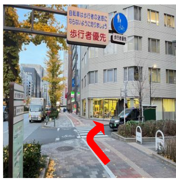
⑥ファミリーマートが見えますのでその直前を右に曲がります。