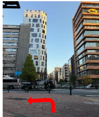
③向こう側の道路に「黒猫（ヤマト運輸）」と「KDXビル」が見える交差点を左に曲がり、そのまま直進します。