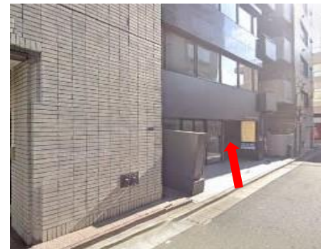
⑦GINZA EAST SQUAREビル（黒色）の入口から入って、エレベータに乗り2階が受付になります。