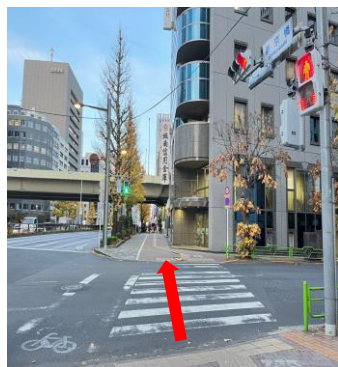
⑤城南信用金庫の方向へ曲がり、30mほど直進します。