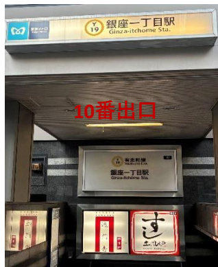
①有楽町線銀座一丁目駅10番出口を地上に出て、左に曲がります。